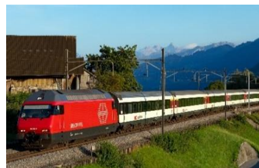
Re460 mit EW IV-Wagen