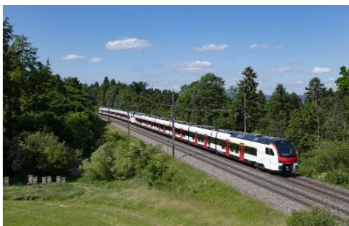
Flirts der modernsten Generation (TSI)