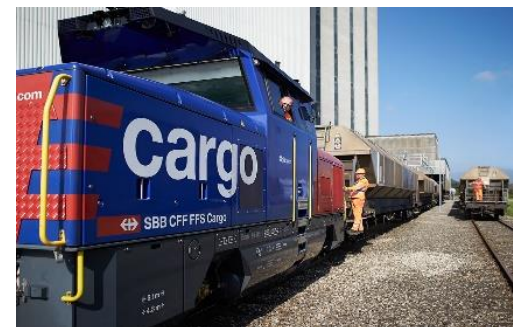
Fahrzeuge Cargo 5038 Güterwagen, 319 Strecken- und 84 Rangierlokomotiven