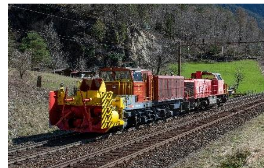
Fahrzeuge Infrastruktur 1000 Fahrzeuge, 80 Typen