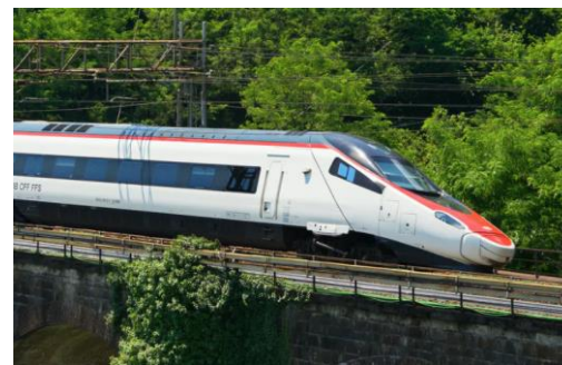
Astoro (ETR 610)