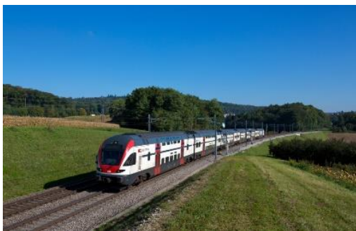
RABe 511 (S-Bahn Zürich)